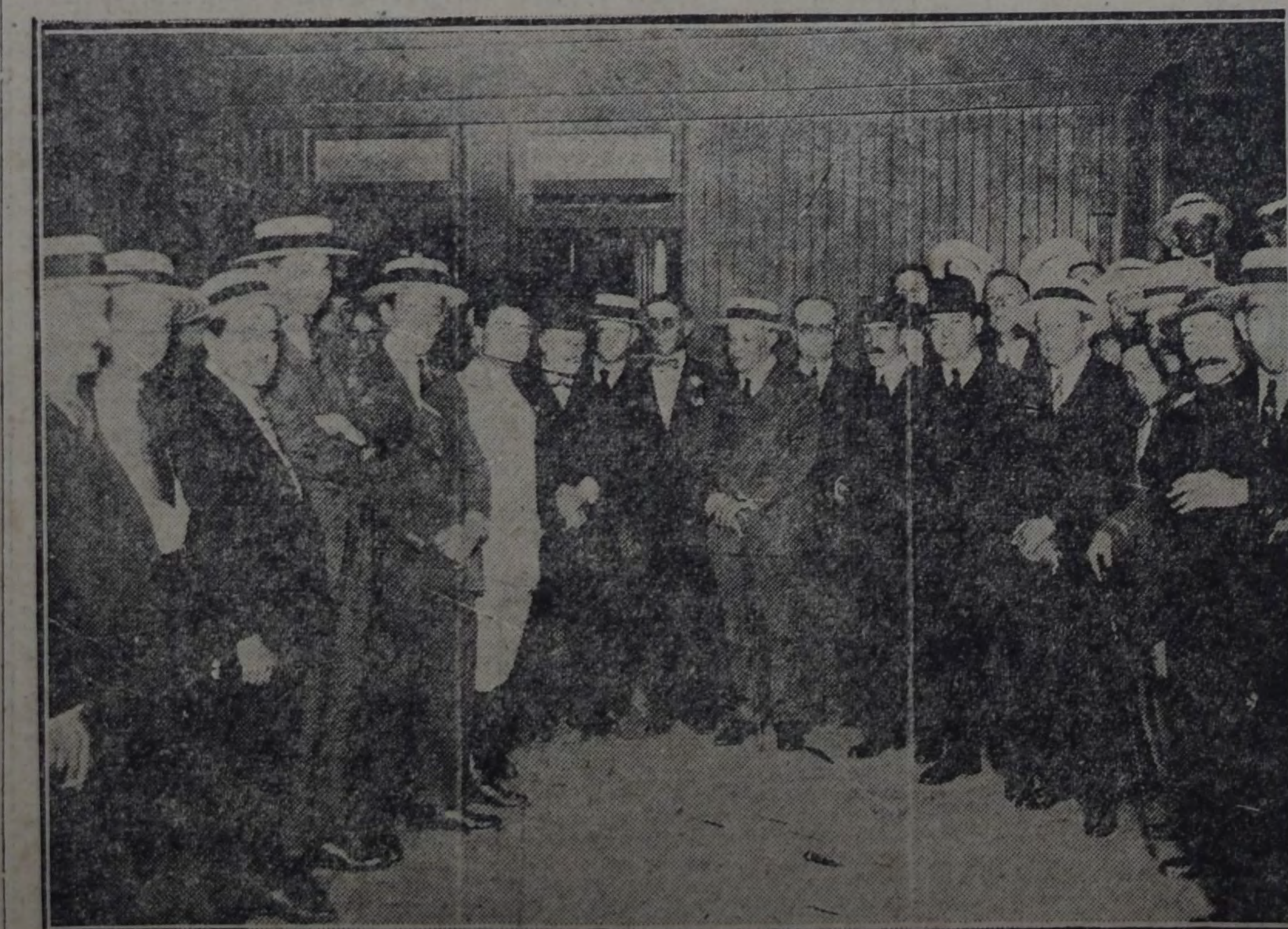
LOS DELEGADOS EN LA ESTACION RETIRO, MOMENTOS ANTES DE PARTIR

A los delegados de la capital, parlamentarios y miembros del Comité Ejecutivo, unieronse muchos de los camaradas del interior, de paso por ésta, algunos de los cuales visitaron antes de embarcarse la redacción de nuestro diario.