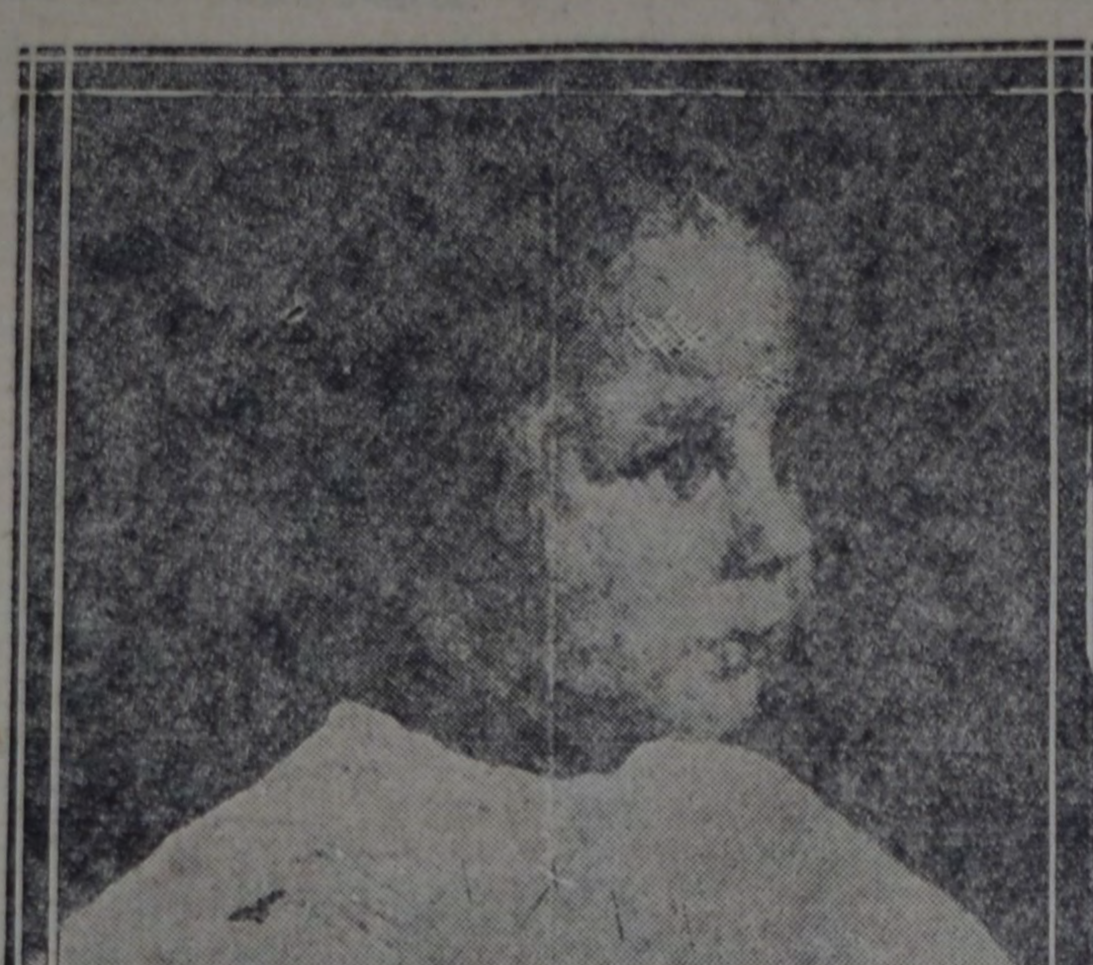
CABEZA DE NINO — Por Carlos Verger